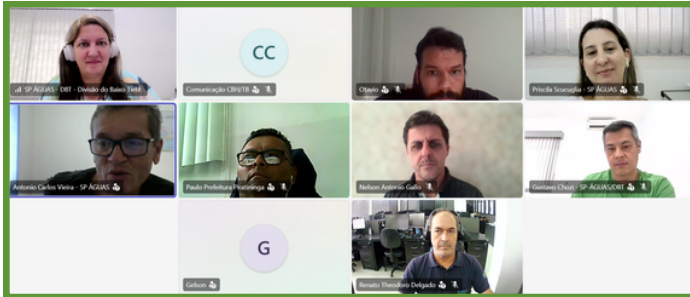
Legenda: 1ª Reunião da CT-SA em 2026 - 11/03/2026