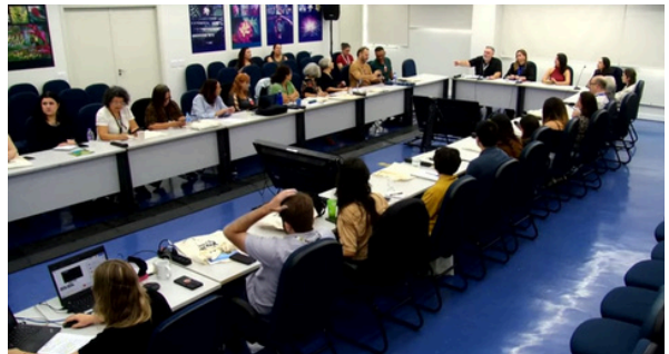
Legenda: Integração das CTEAs do Estado de São Paulo - 31/03/2026

O evento promoveu a troca de experiências e o fortalecimento institucional, com foco em educação ambiental, equidade de gênero e governança das águas.