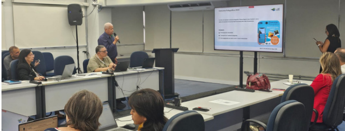
Legenda: 13ª Reunião do FIAR-Tietê - 26/03/2026

Encontro destacou iniciativas dos Comitês e avanços na recuperação do Rio Tietê.