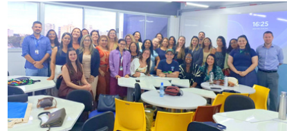
Legenda: Encontro Nacional das CIEAs em Maceió/AL - 22 a 25/04/2026

O Encontro Nacional das CIEAs reuniu representantes de diversas regiões do país para o intercâmbio de experiências, fortalecimento da governança da Política Nacional de Educação Ambiental e construção de estratégias voltadas à cooperação federativa, participação social e fortalecimento da Educação Ambiental como política pública permanente.