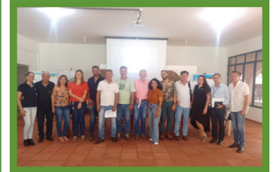
4ª Reunião - 27.03.2023