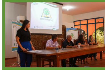
1ª Reunião - 28.04.2022

Integram também as discussões e desenvolvimento do Plano, representantes dos sistemas de educação do Estado (Diretorias Ensino da região de abrangência) e dos Municípios que compõem o CBH-TB (Secretarias ou Departamentos de Educação e Meio Ambiente); dos setores das Universidades que tratam da Educação Ambiental; representantes das organizações da sociedade civil, membros do CBH-TB e algumas empresas que desenvolvem ou possuem interesse na educação ambiental.