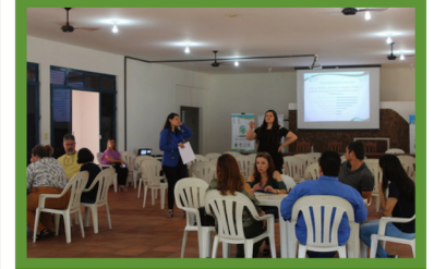
2ª Reunião - 05.10.2023