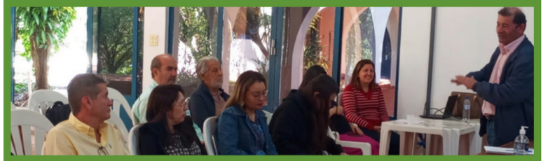
5ª Reunião - 30.06.2023